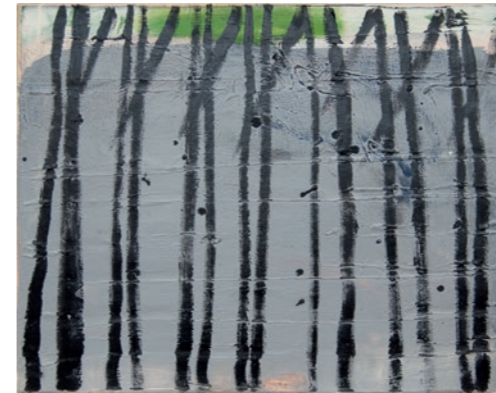
'Landschap met candidassen'