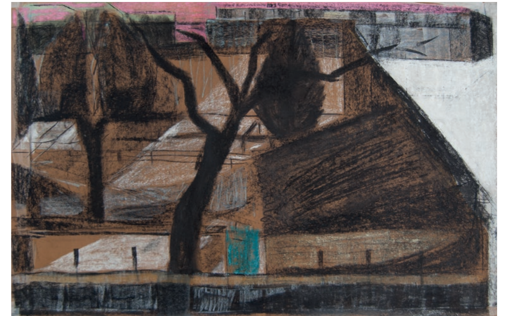
'Zicht op de tuinen'

Het plaatsje Gemert is het fundament van haar leven en kunstenaarschap. Sinds 1987 heeft ze een atelier in de oude nonnenschool van het klooster Nazareth waar ze zelf op school zat. Dat atelier is een kunstenaarsuniversum en als zodanig een metafoor voor haar bestaan. Ze kijkt uit op de kloostertuinen die ze in de winter bijna jaarlijks tekent en schildert. Als ze niet naar buiten kan, ziet en tekent ze vanuit haar atelier de tuinen. De omgeving van het klooster valt er met het licht naar binnen.