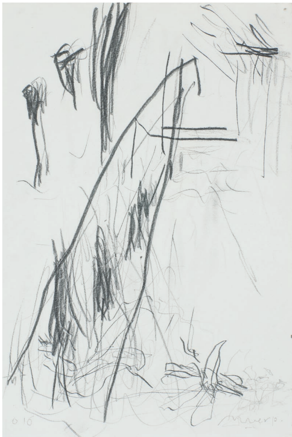
'Sloot bij de Klotbunders'

2016. Uitgave in eigen beheer. Oplage: 50 ex. ©Mariëtte van Erp