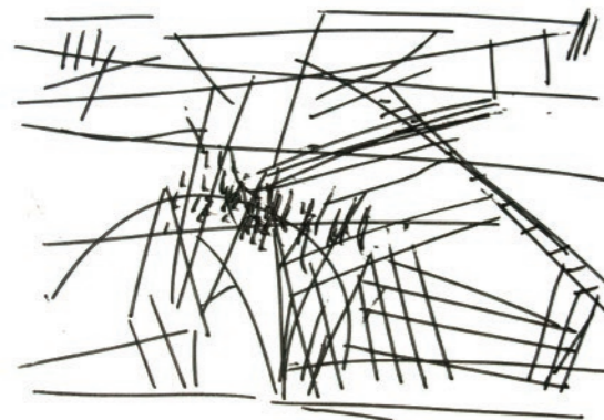
'Zicht op de tuinen'

Na het bekijken van deze expositie zie je wasgoed gegarandeerd met nieuwe ogen.