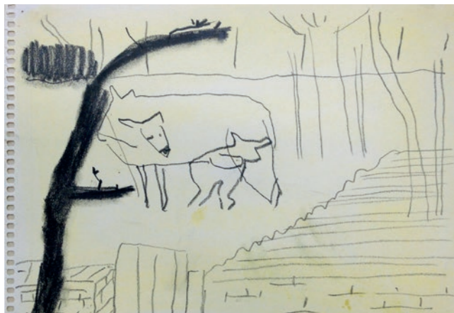
'Zicht op de tuinen'