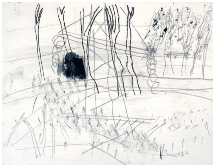
'Landschap bij Gemert'

Dat is geen gemakkelijke opgave en je ziet naast de vanzelfsprekendheid van haar werk ook de ongemakkelijkheid. Hoe direct het werk ook is; kleurrijk en handschriftelijk, bewogen en betrokken, bedachtzaam en weloverwogen, doortrokken en persoonlijk – altijd behelst het iets onbestemds. Het is de kwaliteit van haar kunstenaarschap dat Van Erp met dat onbestemde volkomen vertrouwd is: ze kijkt het recht in het gezicht. Dat vergt zelfoverwinning die maar weinigen gegeven is.