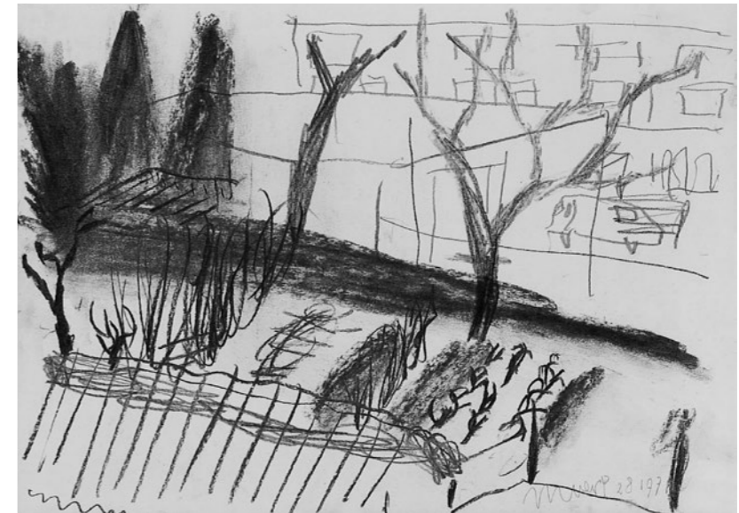
'Zicht op de tuinen'