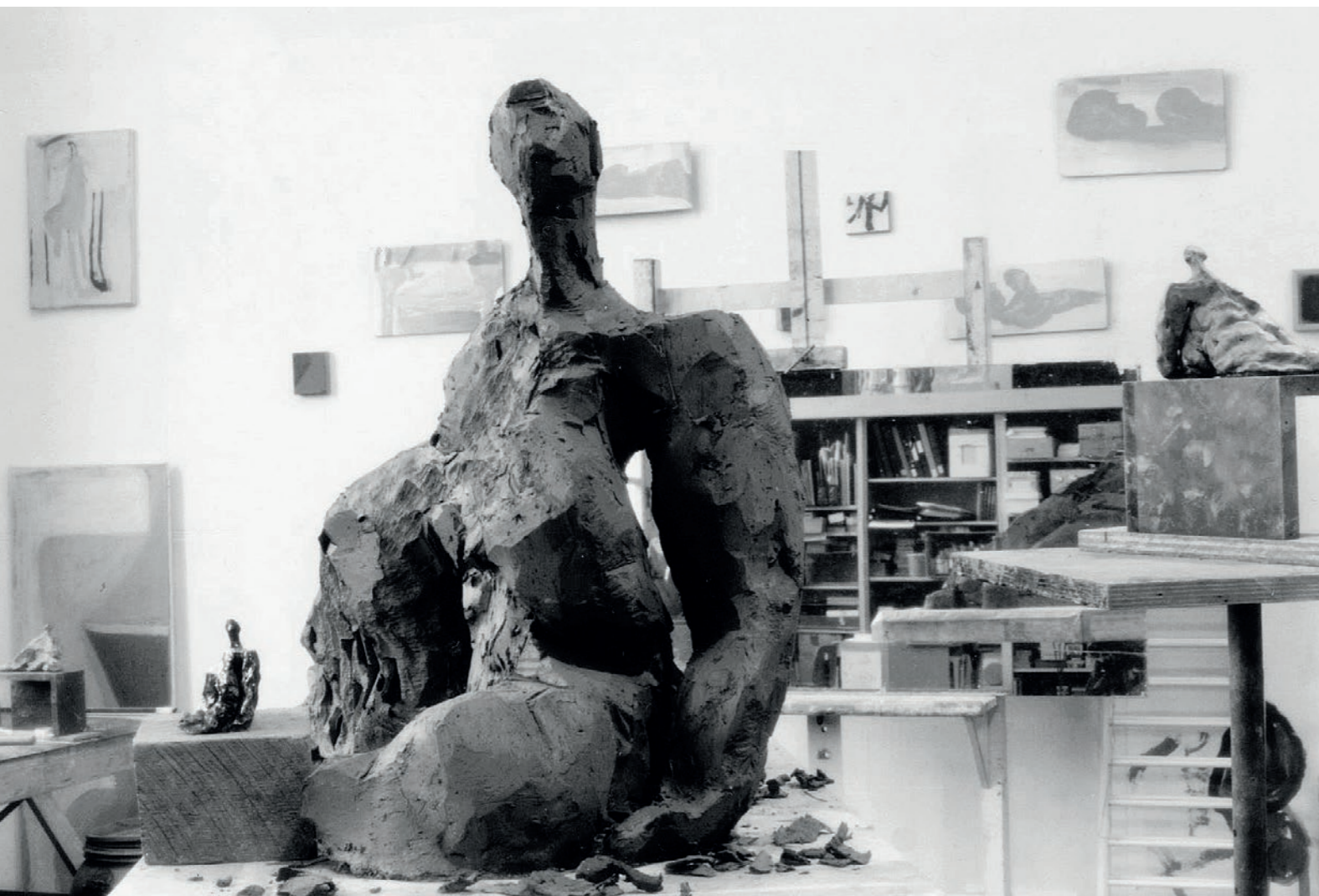
Atelier met 'Piëta' in wording