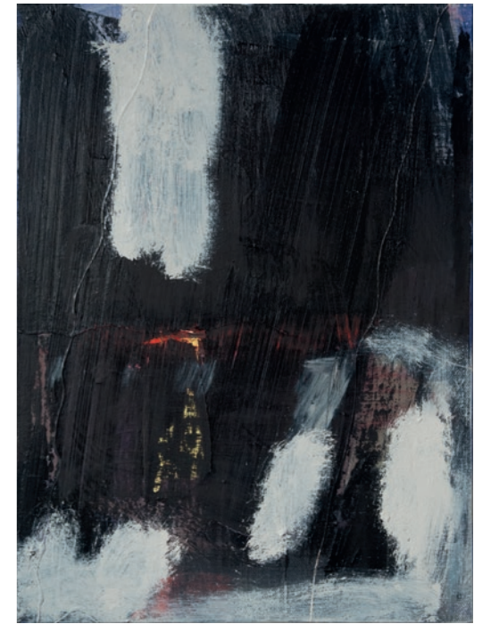
'Knotwilgen in de sneeuw'