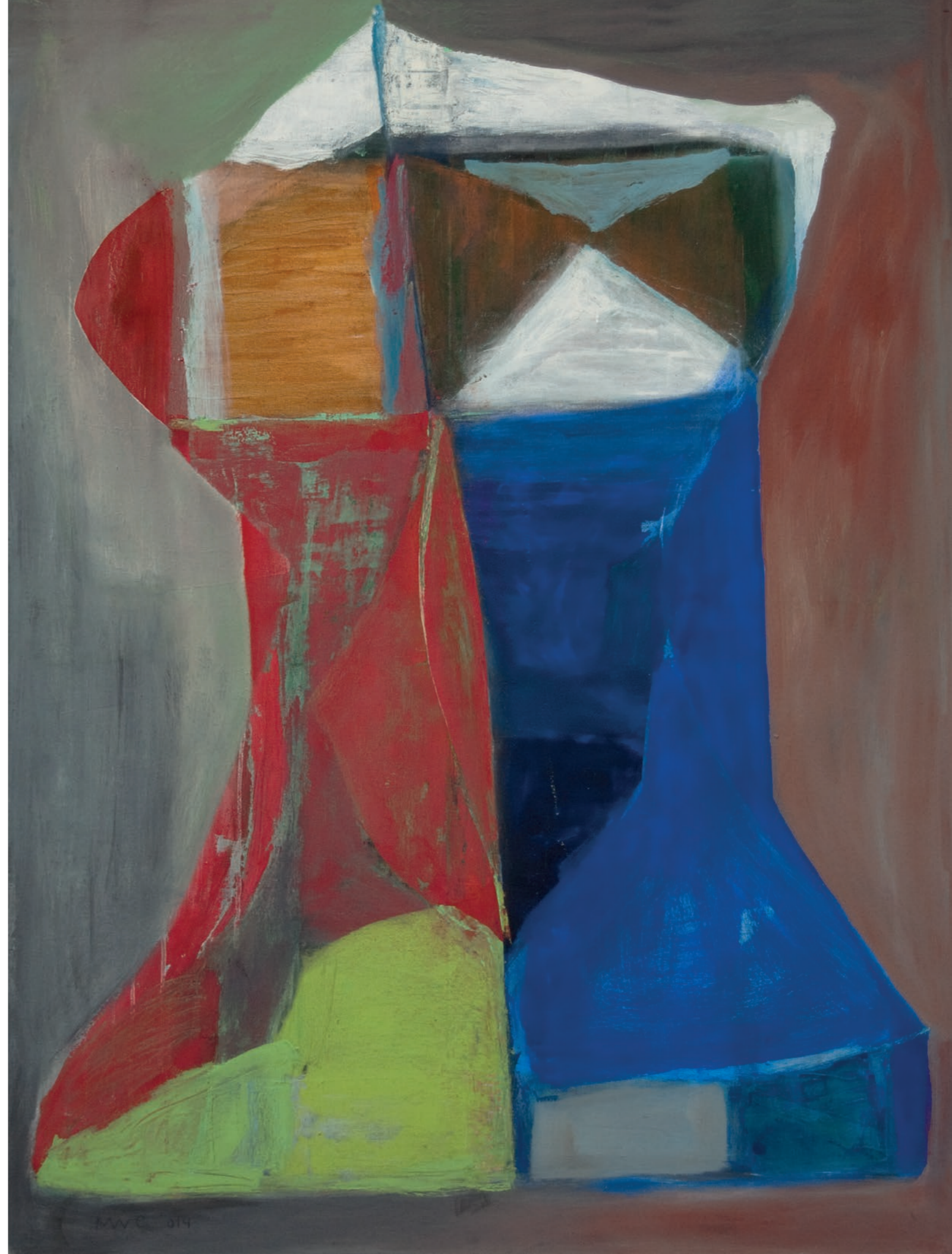
'Les Deux Hollandaises' (à PP)