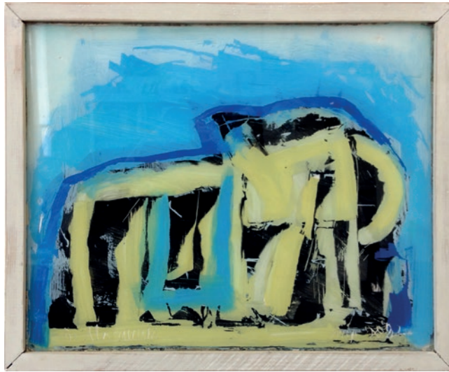
'Olifant in porseleinkast' (à Morandi)