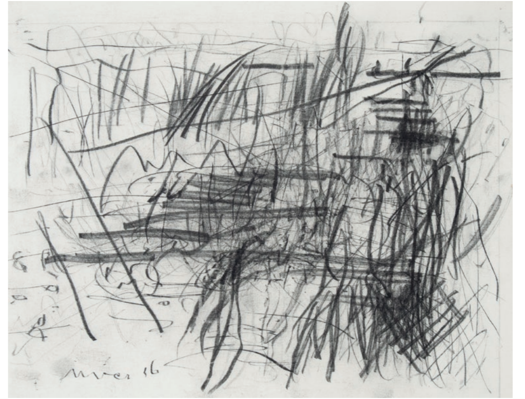
'Sluisje in de Snelle Loop'