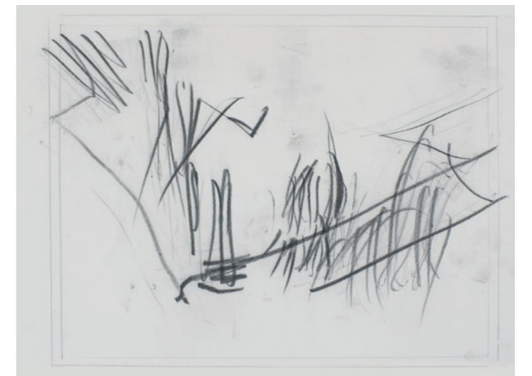
'Sluisje in de Snelle Loop'