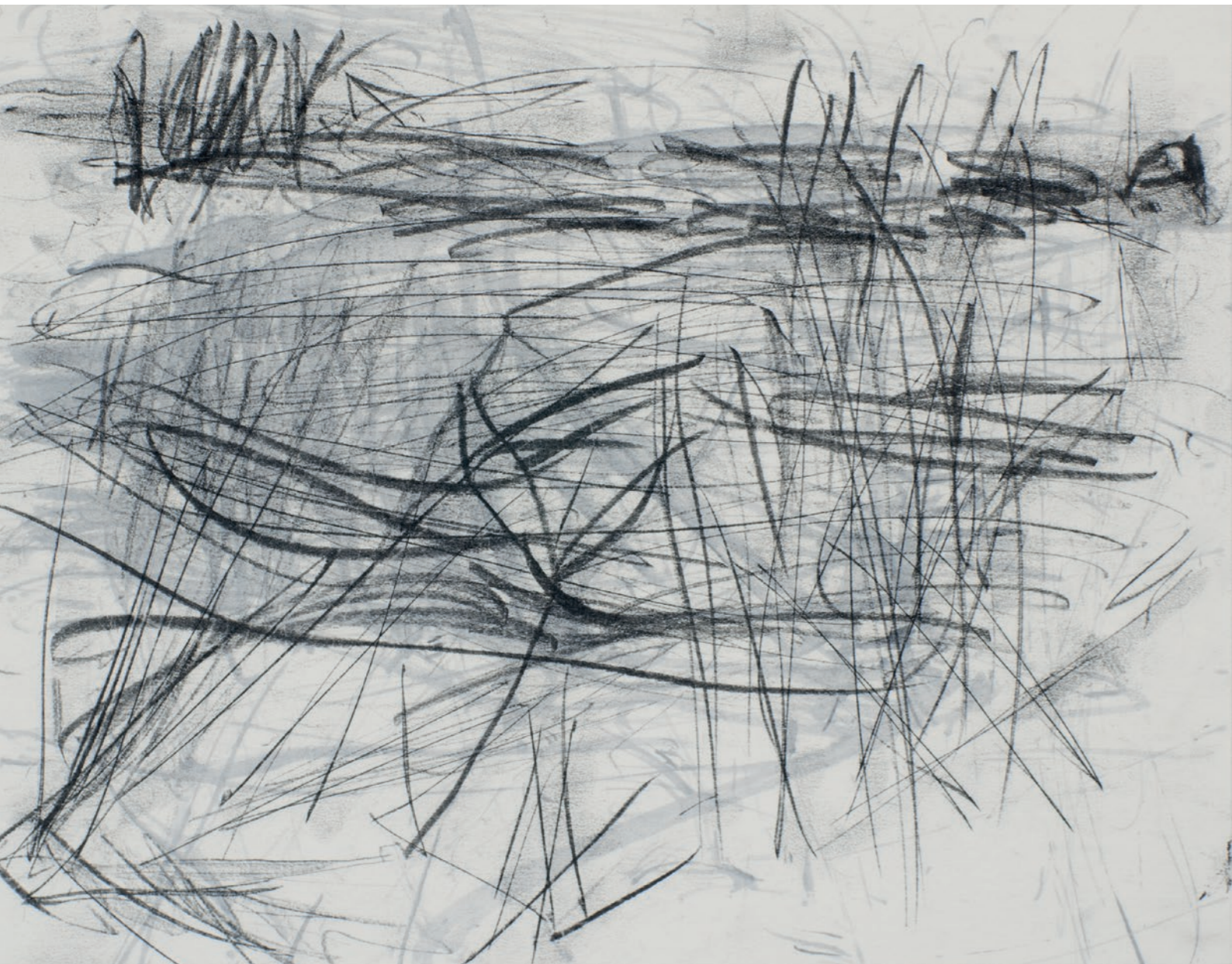
'Langs de Snelle Loop'