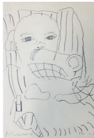
'Kos in Maxi-Cosi'